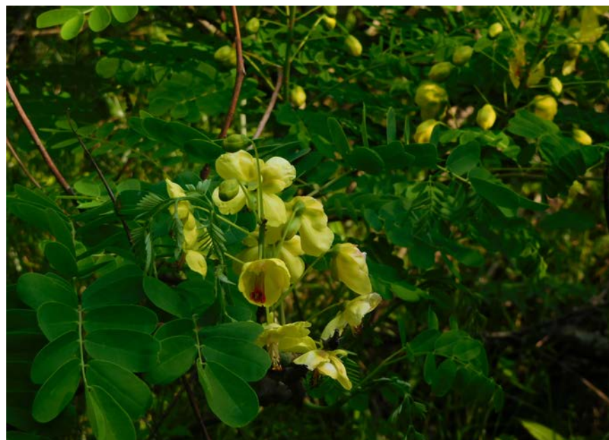
ジャケツイバラ (二俣)